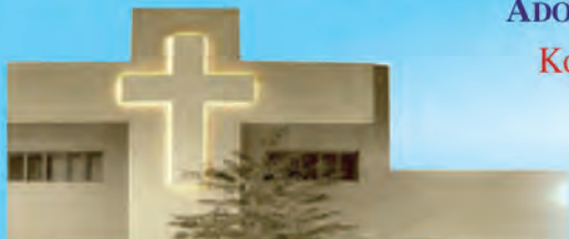
Jezuicki Ośrodek Milenijny

W pierwszy piątek miesiąca - od 17:30 do 19:30